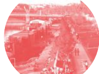
QUAIS DU RHONE