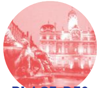
PLACE DES TERREAUX