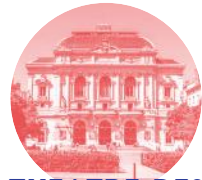
THEATRE DES CELESTINS