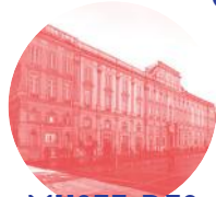
MUSEE DES BEAUX ARTS