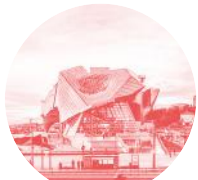
MUSEE DES CONFLUENCES