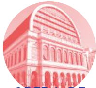
OPERA DE LYON