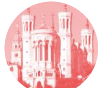
BASILIQUE DE FOURVIÈRE